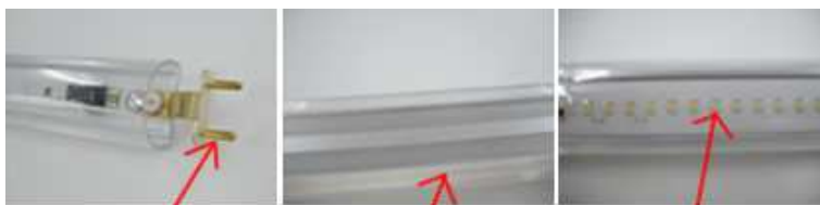
基板一体型の専用ピンで強度対策済み