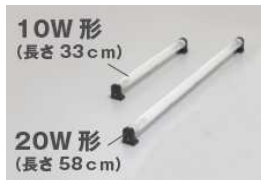
基板全面に透明シリコン充填